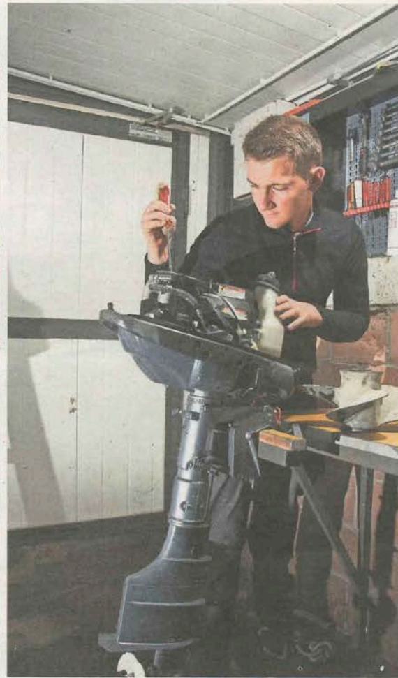
L'agent de bateau fait un travail varié, le plus souvent à l'extérieur, par tous les temps. F. CELLA