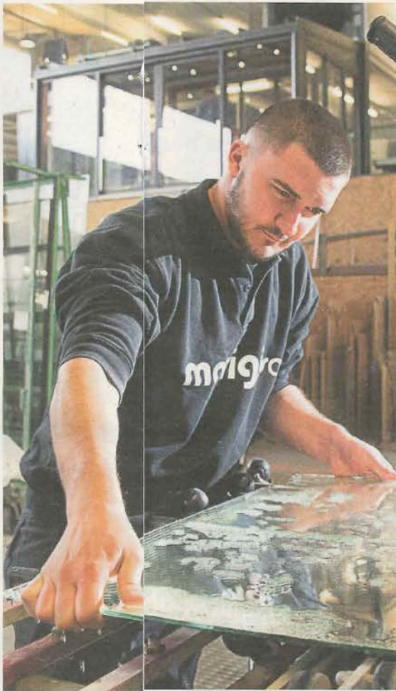
Les vitriers n'ont aucune peine à trouver de leur apprentissage. F. CELLA